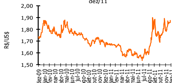
Gráfico 1 - Evolução da taxa de câmbio (R$/US$) - dez/10 - dez/11

Ademais, é importante ressaltar que o dólar teve valorização em relação ao euro no período em função do foco da crise ser na Europa e pela economia norte-americana apresentar recuperação melhor do que a maior parte dos países do velho continente (Tabela 1).